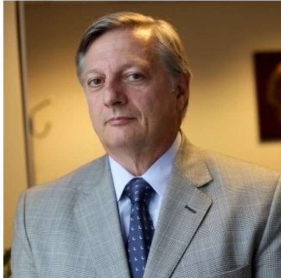
Juan José Aranguren

En Argentine, le gouvernement est bien décidé à augmenter les prix du gaz, de l'eau et de l'électricité. Certaines des hausses annoncées en mars 2016 ont été remises en cause par la justice. Dans le cas du gaz notamment, la Cour suprême a demandé à l'exécutif de revoir sa copie et d'organiser des consultations publiques. La première a eu lieu à Buenos Aires le 16/09/2016.