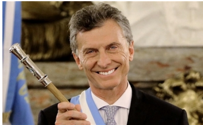
Mauricio Macri

Macri et Fillon sont bien de la même trempe. Fillon avait dit « si j'étais mis en examen (...) je ne pourrais pas être candidat ». Nous savons ce qu'il en est. Macri avait affirmé : « nous allons nous occuper de tout le monde, (...) Nous allons prendre soin des travailleurs qui existent déjà, mais surtout, produire une transformation pour que se multiplient les sources d'emplois ». Un an après : 200 000 emplois supprimés ; doublement de l'inflation à 40% ; factures d'électricité multipliées par 10 ; 1 million de personnes en plus sous le seuil de pauvreté.