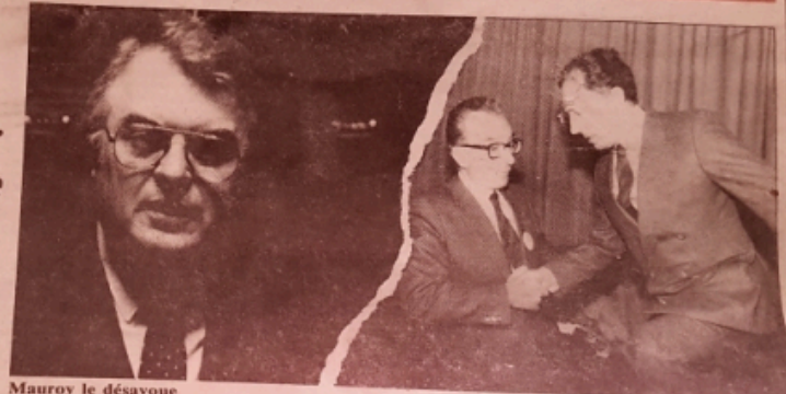
Mauroy le désavoue

En annulant la décision de Delors de piller l'épargne populaire pour verser des milliards aux capitalistes,