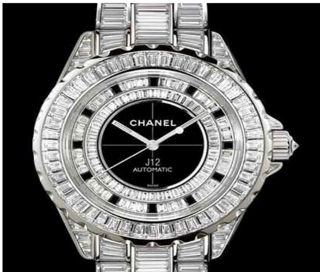
La J12 « 18 place vendôme » la plus chère des montres chanel le prix d'un bel appartement parisien au poignet. En 2007 les exportations suisse ont bondi à 16 milliards de francs suisse ( plus de 10 milliards de francs) c'est-à-dire 50% d'augmentation en 4 ans

" Qu'est-ce qu'une répartition démocratique des richesses ? Une répartition démocratique des richesses doit satisfaire les droits humains fondamentaux : nous pensons que la véritable richesse passe par un développement centré sur l'épanouissement humain, sur les droits et sur l'égalité, et non pas seulement sur l'accumulation de biens ou de revenus. Dans l'égalité, il faut bien sûr entendre aussi égalité homme/femme. La satisfaction des droits fondamentaux commence par l'éradication de la pauvreté qui représente un échec indigne de toutes les démocraties. Le développement humain a pour but de créer un environnement dans lequel tous les individus peuvent développer pleine-