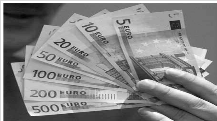
Crise passagère ou crise chronique?

La crise est bien là maintenant et les gouvernements se moquent de nous. L'argent va à ceux qui perdent notre argent en spéculation et il ne reste plus rien pour les êtres humains.