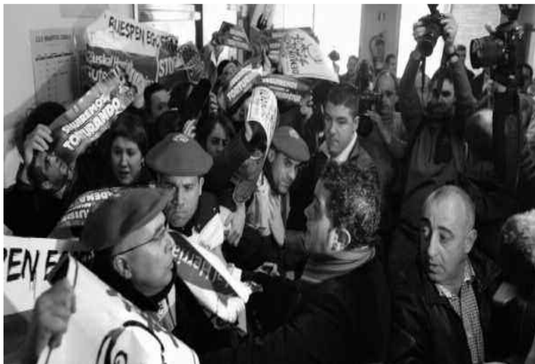
Une crise politique profonde qui commence dans l'Etat espagnol

Communiste des Terres Basques (PCTV) (ex -Herri Batasuna) qui, cette fois-ci en appelaient au vote nul, puisque la nouvelle étiquette politique sous laquelle ils se présentaient, DM3 avait été illégalisée en application de la loi sur les partis. ARALAR a remporté 6% des voix, soit presque le triple qu'aux élections régionales de 2005, ne réussissant qu'en partie à rééditer le score du PCTV (150.000 voix en 2005) qui, lui, se prévaut des 10% de votes nuls.