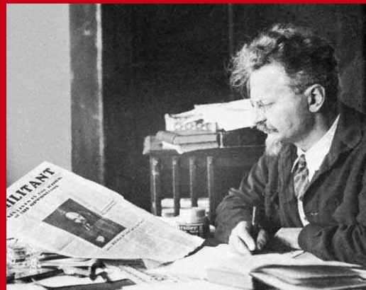
Léon Trotsky (1879-1940)