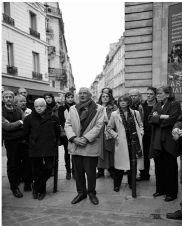
Une partie des signataires de l'appel pour SAUVER LES ARCHIVES s'est réunie devant un mur symbolique de cartons d'archives vides lors d'un point presse le 26 mars 2009.

matière d'accessibilité aux sources, tant pour les historiens que pour les généalogistes". Pour elle, "la disparition de la DAF et son assimilation à un patrimoine