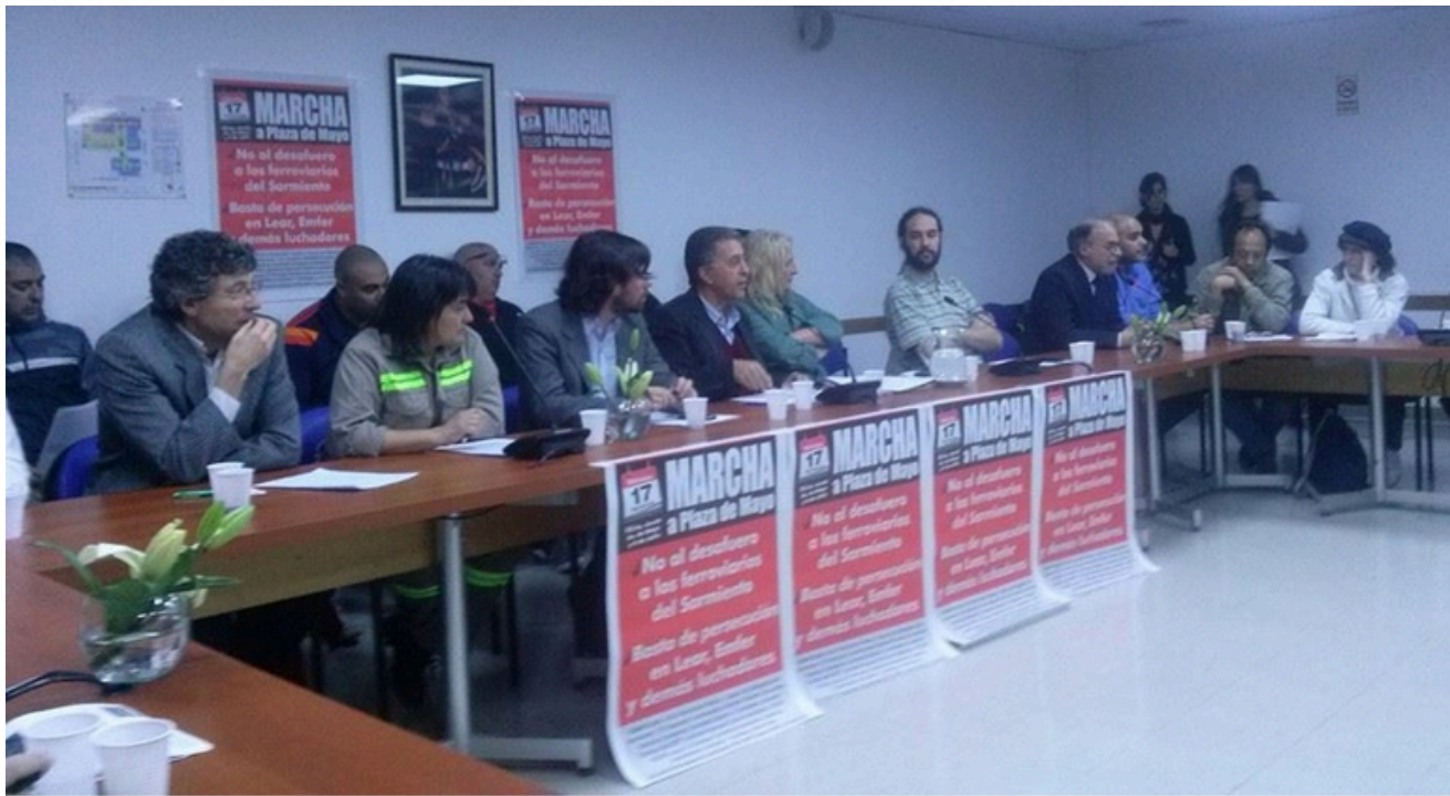
FERROVIARIOS EN EL CONGRESO CON LOS DIPUTADOS DE IZQUIERDA