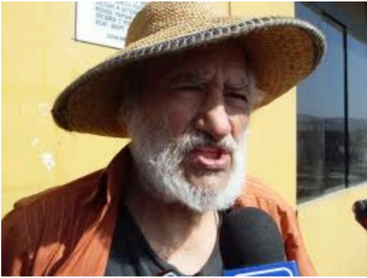
Dirigente campesino y de izquierda peruano, Hugo Blanco manifestó su solidaridad con ferroviarios argentinos