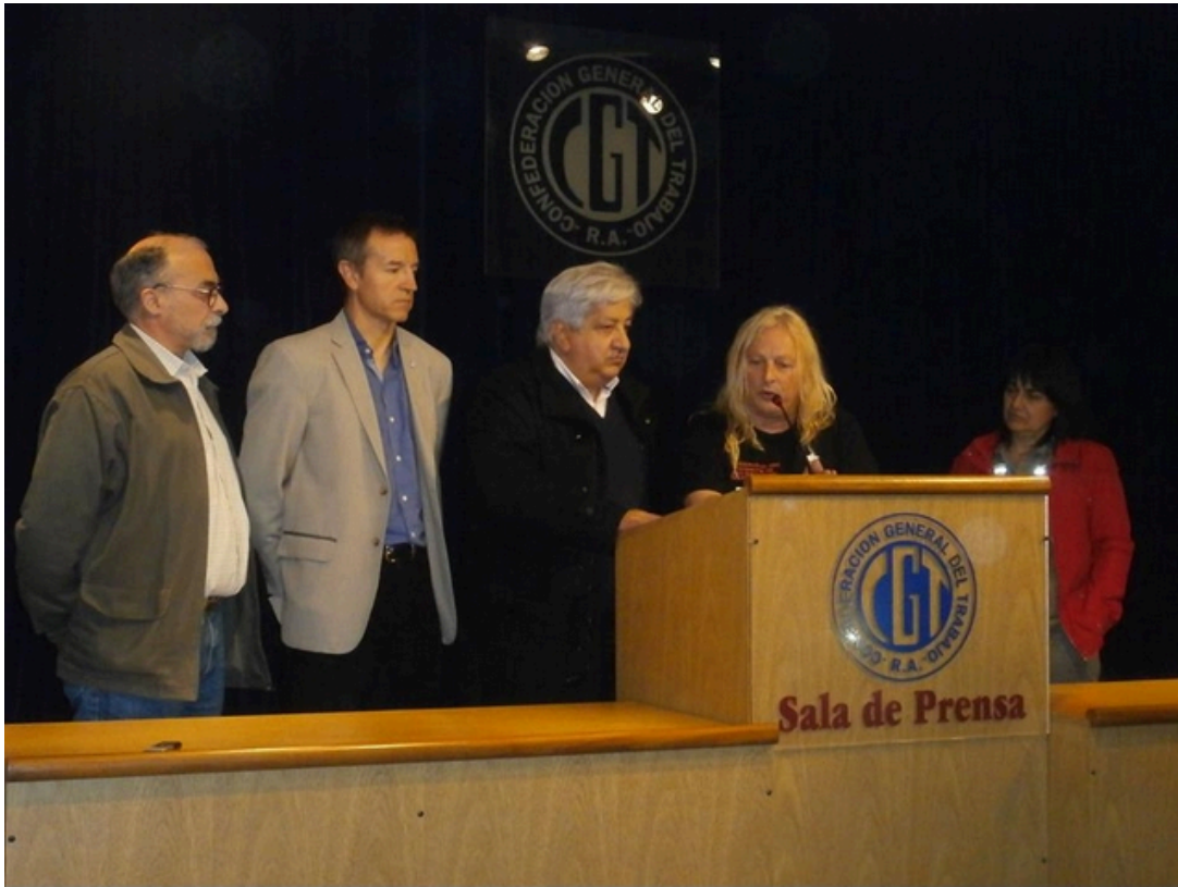
Conferencia de prensa de ferroviarios con la Confederación General del Trabajo