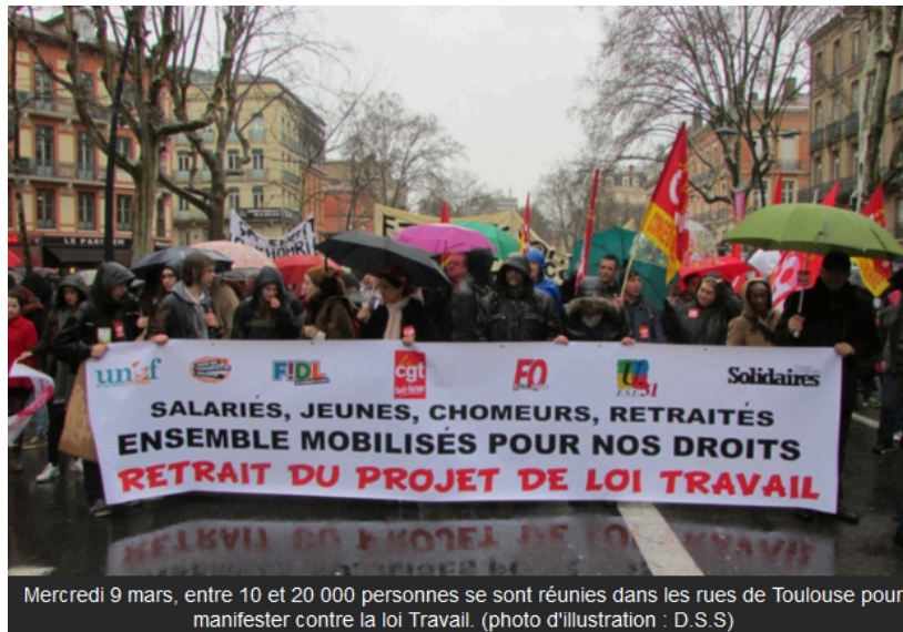
Mercredi 9 mars, entre 10 et 20 000 personnes se sont réunies dans les rues de Toulouse pour manifester contre la loi Travail.