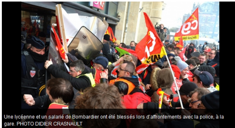
Une lycéenne et un salarié de Bombardier ont été blessés lors d'affrontements avec la police, à la gare.

A tout le moins, le caractère anticapitaliste, antigouvernemental du mouvement saute aux yeux de tous. La volonté d'en découdre se lit dans les affrontements qui ont émaillé la manifestation à Valenciennes ( 2500 personnes) : salariés de Bombardier, Toyota, lycéens. Cette confrontation jetant une lumière crue sur la violence policière que Hollande-Valls sont prêts à déchaîner, à l'aveugle.