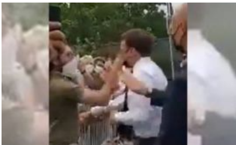
La gifle et la manifestation du 12 juin 2021

Toute la situation porte en elle les germes d'une crise révolutionnaire. Sous les coups de butoir de la lutte de classes, la Ve République, ses institutions, ses partis, sont dans un état de... »